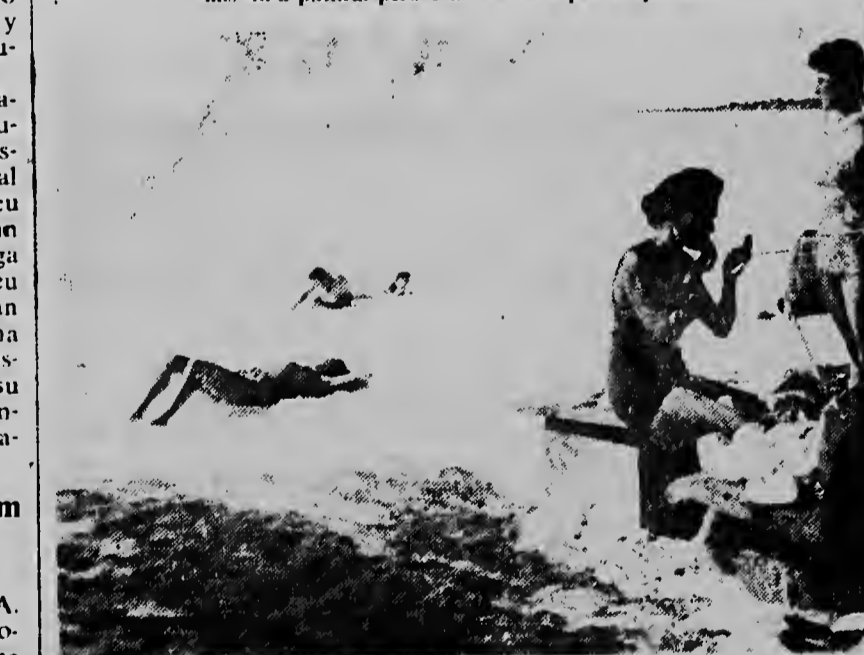
Y cu hasta na beach e make-up no por worde descuida nos ta descubri un Beach Club na unda nos ta saca e portret ki. Berdaderamente un belleza e naturalesa....